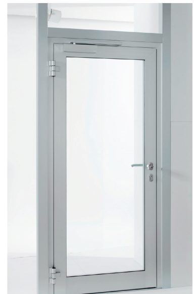
TS 91 Tamaño EN 3