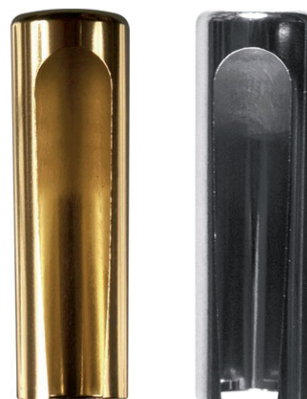
Capuchones para pernios Anuba